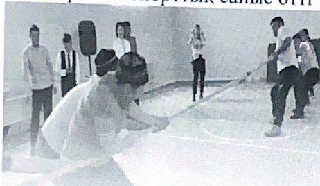
“Әкем, анам және мен” қазақтың ұлттық ойындарынан спорттық сайыс

Қаңтар айының 18 күні “Әкем, анам және мен” тақырыбында 7а,7ә сынып оқушылардың және ата-аналарының қатысуымен қазақтың ұлттық ойындарынан спорттық сайыс өтті