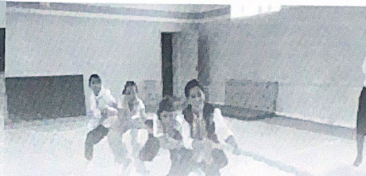
“Әкем, анам және мен” қазақтың ұлттық ойындарынан спорттық сайыс